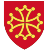
Marquisat de Provence 1125 - 1274