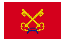
Drapeau du Comtat