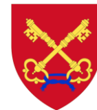
Blason du Comtat 1274 - 1791