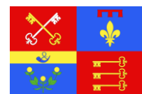
Drapeau du Vaucluse 1791

C'est le 28 février 1276 qu'apparaît pour la première fois, en tant que telle, dans l'histoire, la communauté juive de Carpentras, exemplaire pour toutes les autres communautés judaïques du Comtat Venaissin. Ce jour-là, l'évêque Pierre Rostaing réunit les 63 chefs de famille, dont 14 de l'extérieur et les autres autochtones, représentant les 300 personnes formant la susdite communauté, tous les délégués ayant dit être d'ascendance locale de tout temps.