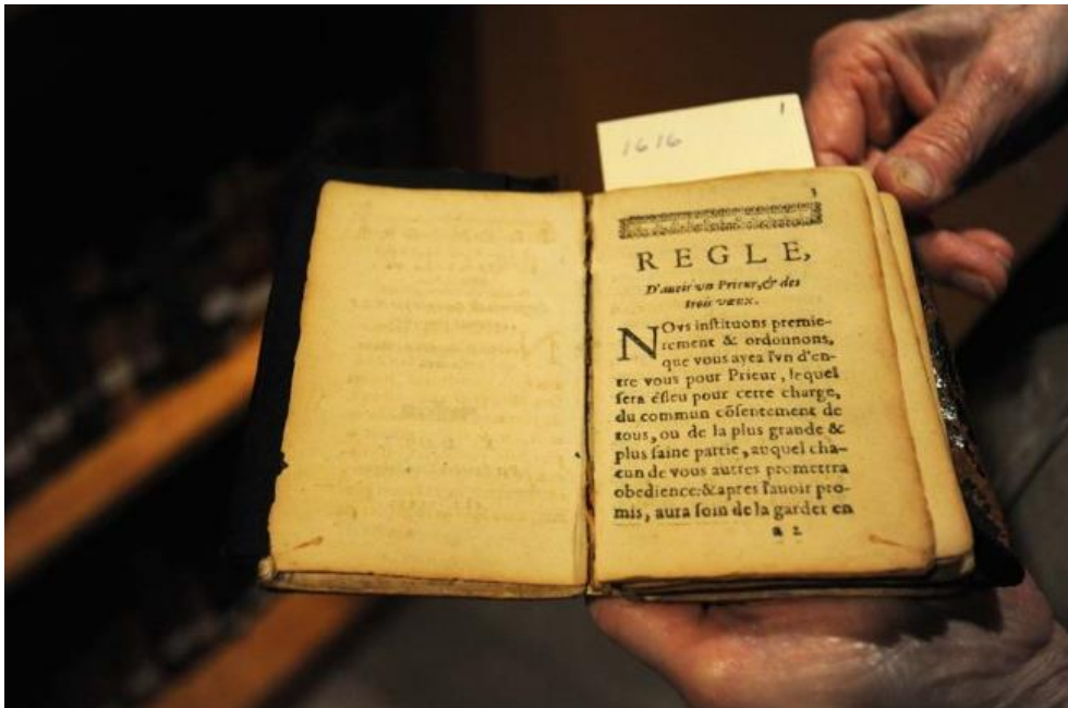
Règle de Saint-Albert imprimée en 1616. Carmelite Monastery 1318 Dulaney Valley Road Baltimore, Maryland