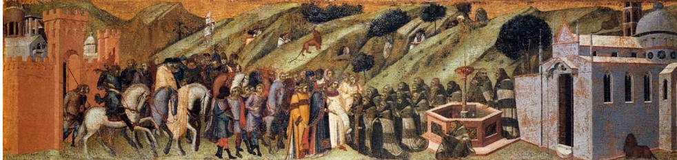
St. Albert presents the Rule to the Carmelites – 1328-1329. Pietro Lorenzetti – Pinacoteca nazionale di Siena.