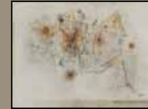
Le bateau ivre