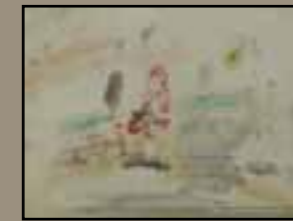
Conversation avec Engel