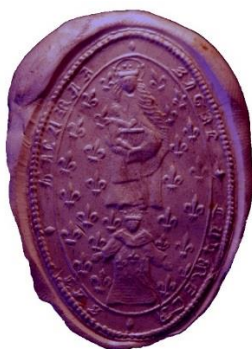
Sceau de Saint-Hilaire. Original conservé au Musée Calvet à Avignon.